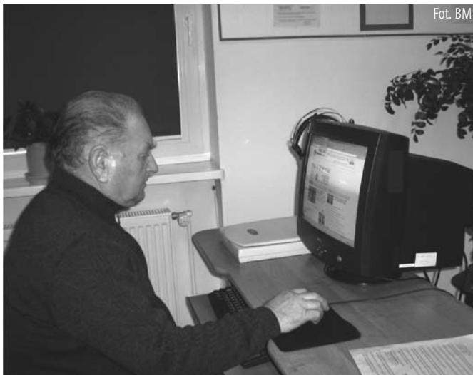
Internet dla seniorów

Internet we współczesnej rzeczywistości urósł do rangi nie tylko powszechnie stosowanego komunikatora, źródła wiedzy, informacji, ale wręcz wirtualnej cywilizacji. Stał się środkiem, bez którego już nie sposób funkcjonować w świecie wiedzy.