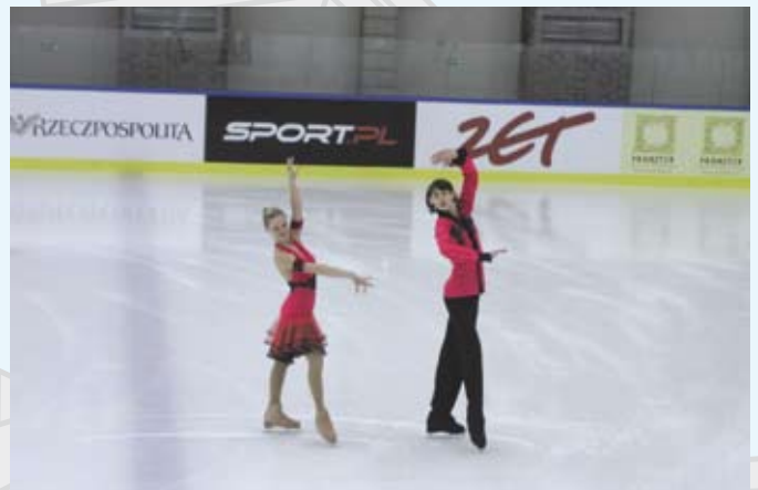
Pokazy par tanecznych