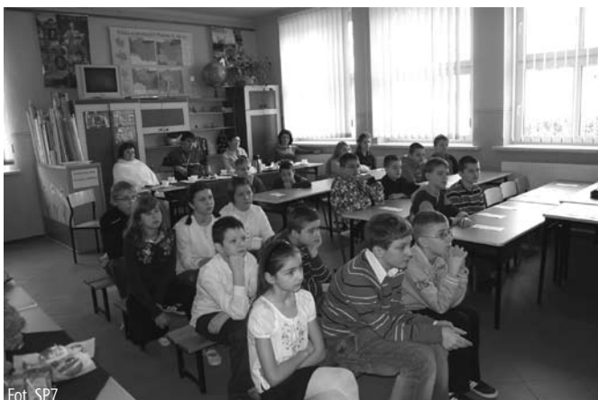
Uczniowie słuchający wykładu