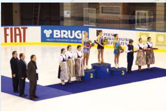
Dekoracja najlepszych solistek