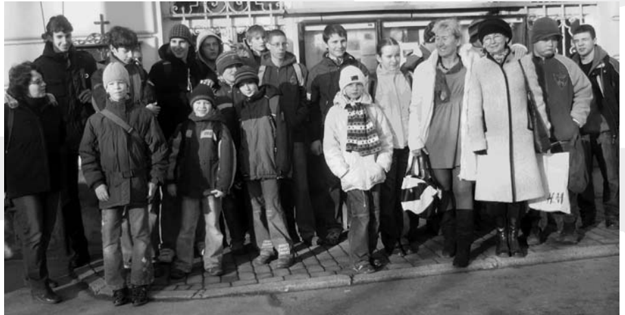
Grupa młodzieży z opiekunami

W tym roku aura nie dopisała w ferie zimowe – zresztą podobnie jak rok temu. Ale opiekunowie zimowiska w parafii św. Elżbiety w Cieszynie, organizowanego przez Parafialny Oddział Akcji Katolickiej, nie dali za wygraną i przez 10 dni zapewniali dzieciom i młodzieży różne zajęcia.