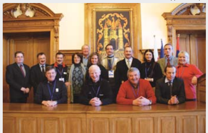
Spotkanie przedstawicieli Europejskich Komitetów Olimpijskich z władzami miasta w sali sesyjnej