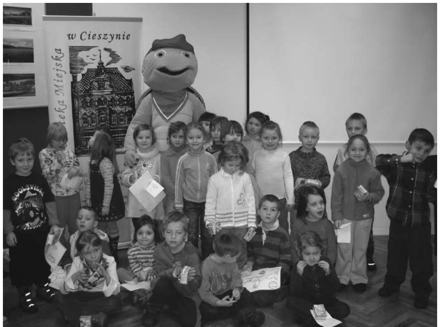
Żółwik Franklin z najmłodszymi czytelnikami

Żółwik opowiedział o swoich przygodach, bawił się z dziećmi, zaprosił najmłodszych do wspólnej lektury oraz na prośbę matych fanów, niemalże bez końca,