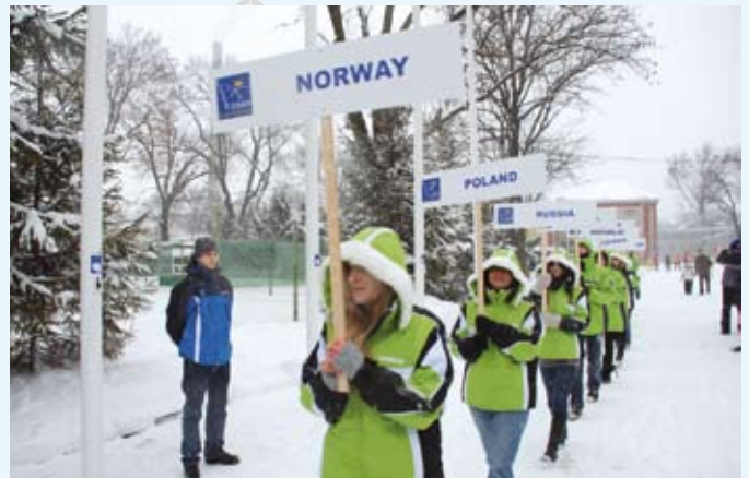
Prezentacja państw biorących udział w Festiwalu