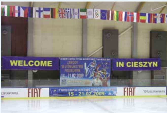
Lodowisko wita uczestników imprezy